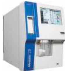
Medonic M32C - kapalı tüp örnekleme, kirlenmiş kan riskini en aza indirir.