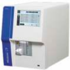
Medonic M32B temel modeli bilekırpma valfi teknolojisini içerir.

USB portu gelişmiş bağlantı ve iletişim sağlar.