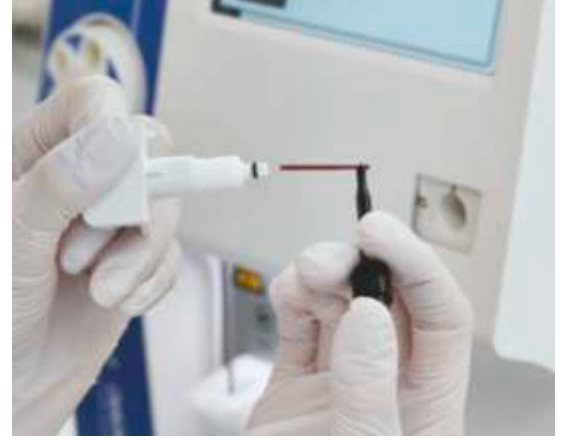
Medonic M-serisi M32 analizörleri sadece 20 ul kan örneğinden tam bir CBC verir. Çocuklar ve kan bankaları için mükemmeldir.

Bu durumlarda oto yükleyici M32S tezgahınızda bulunmak için ideal bir alettir. Yeni M32 serisinin en üst düzey modeli olduğundan mükemmel ve hızlı bir analizördür ve birçok küçük ve orta ölçekli hastaneler için idealdir. Sadece 2 x 20 numuneye kadar ön yükleme yapın ve bırakın işi o yapsın!