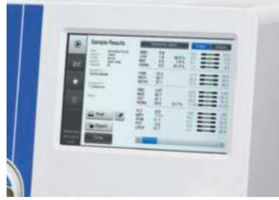
Modern kullanıcı ara yüzü. Temiz, düzgün tasarımı verimli işlemi ve sonuçların doğru bir şekilde değerlendirilmesini sağlar.

Medonic M serisi M32 hematoloji analizörleri, kalite hematoloji ölçümlerinde kesintisiz bir teknik bilgi zinciri olan aletler, reaktifler, kalite kontrol malzemeleri ve servis içeren toplam kalite konseptinin bir parçasıdır.