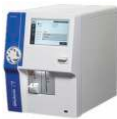
Medonic M32M - beş numune karıştırıcısı doktor ofisleri ve küçük laboratuvarlar için idealdir.