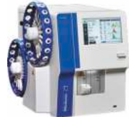
Medonic M32S - 2x20 numune kadar oto yükleyici. Sadece yükleyin ve gerisini ona bırakın.