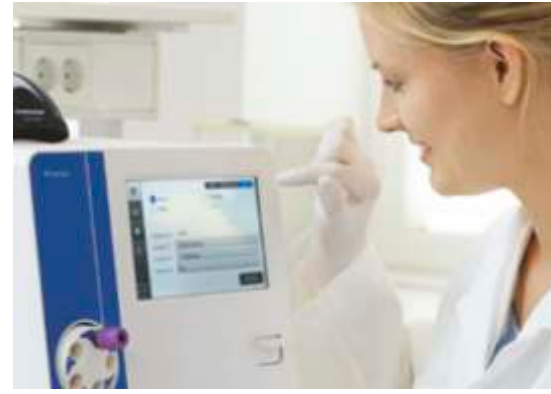
Geliştirilmiş yazılım, çalışma süreçlerini basitleştirir ve kullanıcılara örnek sonuçların ve hasta kayıtlarının daha iyi kontrolünü sağlar.