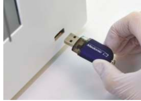
Medonic M-serisi M32 analizör kullanıcıları, geniş bağlantı seçeneklerinden dolayı gelişmiş veri iletişiminden yararlanılır.